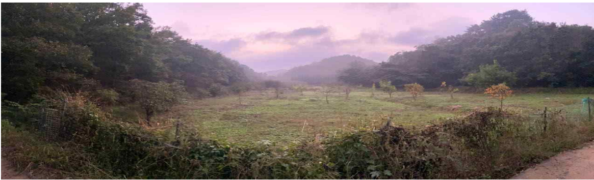
▲ 김기현 원내대표 소유 임야 진입로에서 바라본 사진