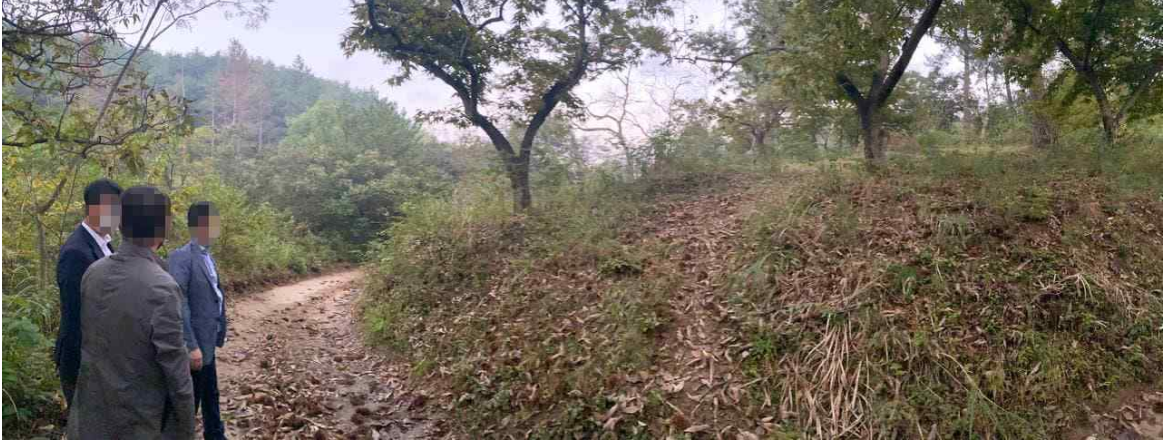
▲ 김기현 원내대표 소유 임야 내부 구릉지 인근